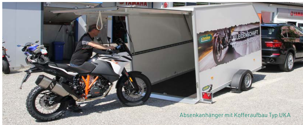
Absenkanhänger mit Kofferaufbau Typ UKA